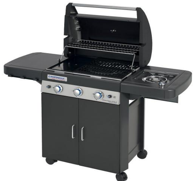
3 SERIES CLASSIC LS PLUS D