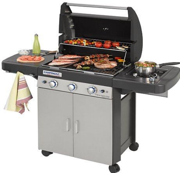
3 SERIES CLASSIC LS 3 SERIES CLASSIC LS PLUS