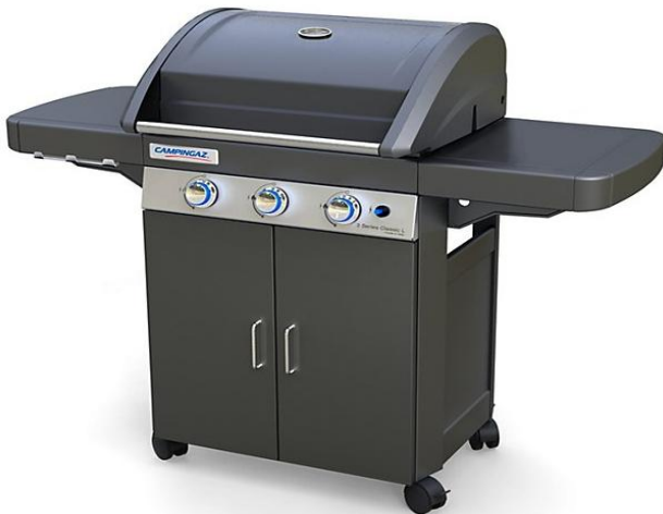
3 SERIES CLASSIC L PLUS 3 SERIES CLASSIC LD PLUS