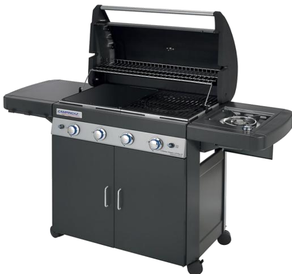
4 SERIES CLASSIC LS PLUS D