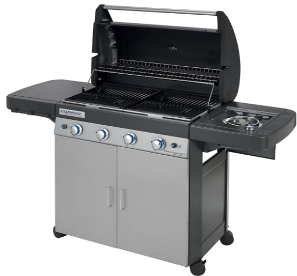
4 SERIES CLASSIC LS G