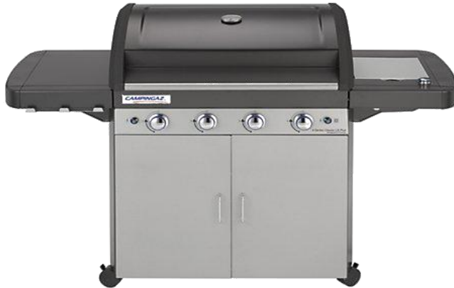
4 SERIES CLASSIC LS / LS PLUS