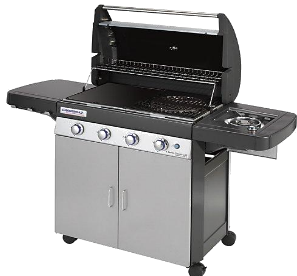
4 SERIES CLASSIC LXS